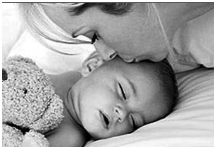
Amor y cariño de una madre hacia su hijo.

Ni receta ni edad mínima. Desde este verano cualquier persona podrá comprar, por más o menos 20 euros, la píldora del día siguiente en la farmacia. Se trata de la última medida del Gobierno anunciada el pasado lunes por las ministras de Igualdad y Sanidad.