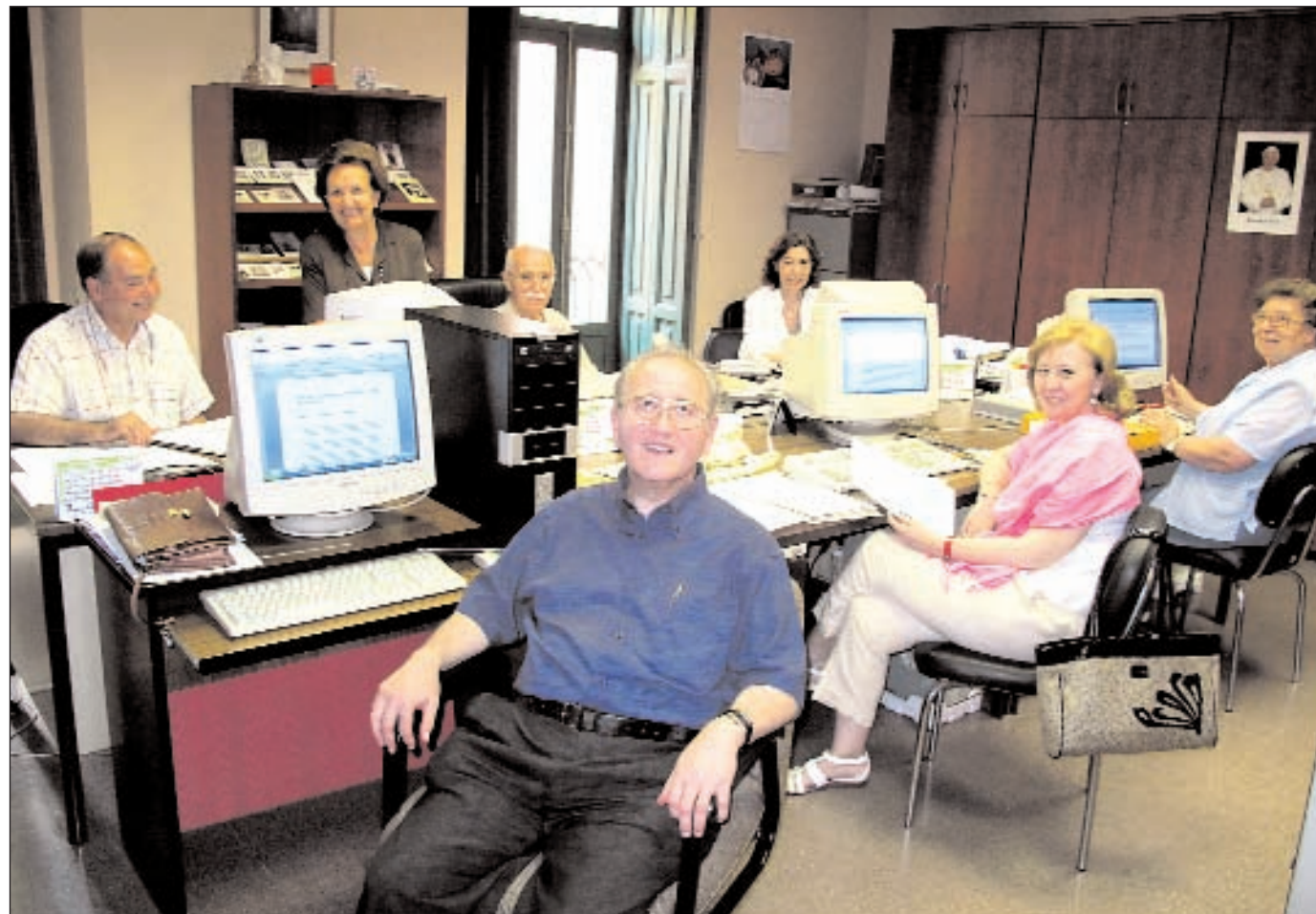
La Delegación para las Causas de los Santos de la Archidiócesis de Valencia