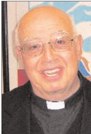
compositores, artistas, mártires -¿Cuál es la alegría más gran-

-Allí recogí biografías de 3.003 sacerdotes de todas las diócesis españolas del siglo XX. De los que han destacado por alguna cosa especial tanto en el campo eclesial, de la música, las ciencias, la cultura, el arte... hay