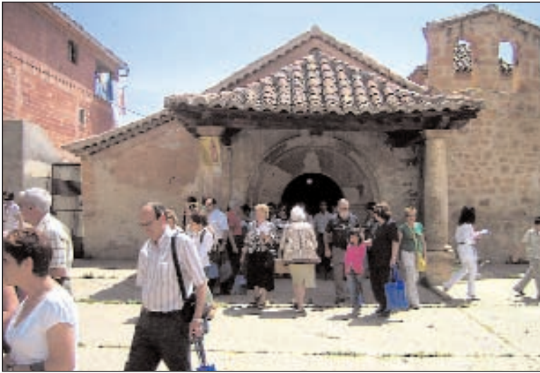
Peregrinos en la Ermita Virgen de la Huerta, del siglo XIII, en Ademuz

-(Risas) En ocasiones es casi tierra de misión. Hay personas muy creyentes, pero en ocasiones hay que reevangelizar al propio cristiano que ha caído